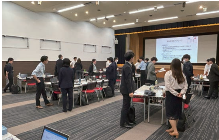
ペアワークの風景