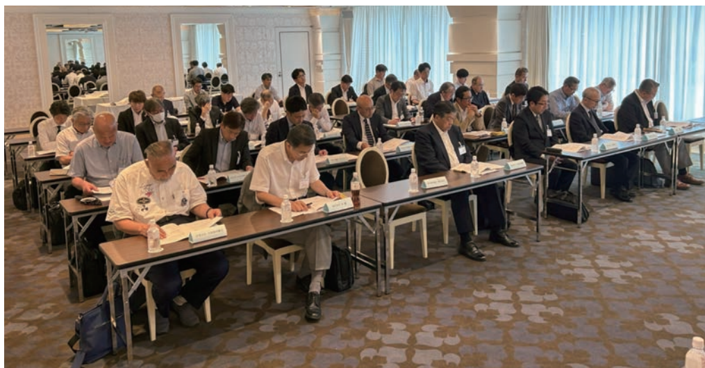
説明を聞く参加会員

HPを改定し、損害鑑定人、当会の周知を進めます。KANTEI NEWSを発行するなど、損害鑑定人の業務の理解が深まるよう、広報を進めていきます。