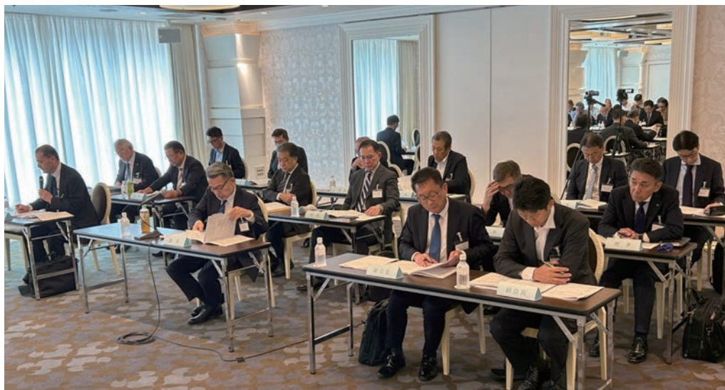
議事進行を行う理事