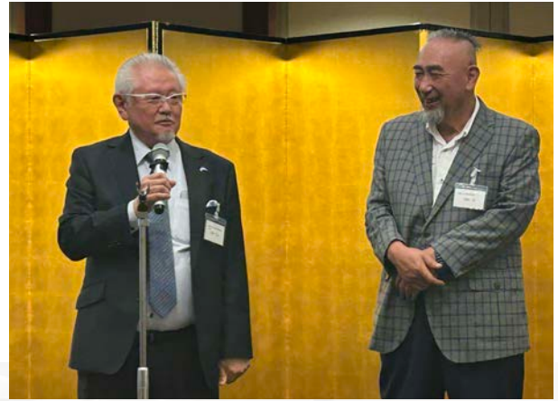
50年史作成メンバーの森園社長と中村社長